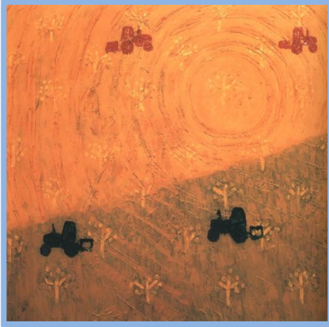
פיזווי בוקר (ידי רובין)

מתגלה שזוהותה מורכבת בבד בבד מנטיותיה, תכונותיה ואופייה, ולצידם, מאוסף המפגשים, ההתייחסויות ומערכות היחסים שהיא מלקטת סביבה, ורות אכן הופכת את מלאכת הליקוט לאומנות. רות היא דוגמה מובהקת לדברי מדרש תנחומא על שמותיו של אדם: "אתה מוצא שלושה שמות שנקראו לו לאדם: אחד מה שקוראים לו אביו ואמו ואחד מה שקוראים לו בני אדם ואחד מה שקונה הוא לעצמו. טוב מכולן מה שקונה הוא לעצמו." (מדרש תנחומא, פרשת "ויקהל", א').